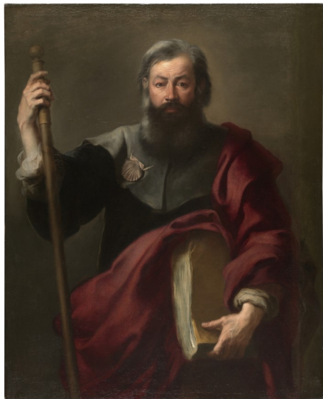
Santiago Apóstol, pintura de Bartolomé Esteban Murillo, Museo del Prado

Es justo aclarar que Thyago es su nombre, es Santo, claro que sí, lo que sucede es que en nuestro idioma moderno lo hemos fundido ( simplificado) y simplemente escribimos Santiago o Santy. Decir San Santiago no es correcto, porque teórica, etimológica y espiritualmente puede que no exista un doble santo, o que puede ser santo en otro orden superior el que ya lo es, es santo y punto. Lo mismo sucede con San José, puede que el amor, el respeto y las ganas de exaltar su papel en la humanidad y la sagrada familia que celebramos el día de los santos inocentes este año, nos lleve a cometer ese error, pero el modo correcto es San José, nada simple ser el padre putativo de Jesús, muchos por respeto pero ignorancia o poca información le dicen San San José. ¡Ese modo es incorrecto!