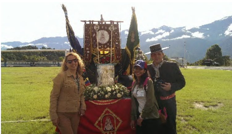
Recuerdo de la misa de bienvenida a nuestro cardenal rociero, hermano mayor y arzobispo Su Eminencia Don Baltazar Enrique Cardenal Porras Cardozo el tres de diciembre de dos mil diecisiete en la Hechicera (nuestra sede canónica).

emoción la esperan, aclaman y veneran con sus sevillanas y flamencas para deleite de todos. Las misas sabatinas se convirtieron en una hermosa costumbre y a través de ellas diferentes parroquias de la ciudad de Mérida han conocido y aprendido a querer nuestra bella advocación.